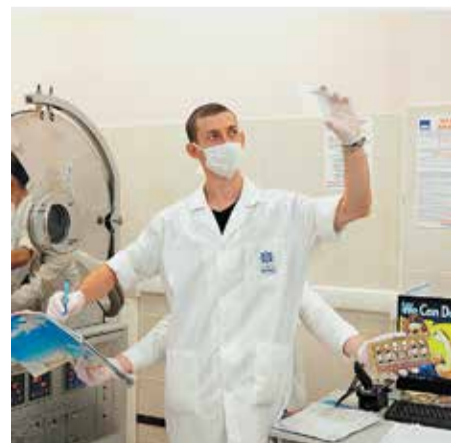
1 МЕСТО Фоторабота: «Нам всё по плечу!» Автор: Антонов Марк Петрович Организация: Ижевский электромеханический завод «КУПОЛ»/ППО

В рамках Всемирного дня действий профсоюзов «За достойный труд» Федерацией профсоюзов УР был объявлен фотоконкурс «Профессия в лицах». В оргкомитет конкурса поступило 99 фоторабот.