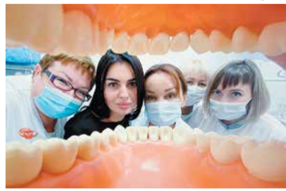
3 МЕСТО Фоторабота: «На страже Вашей улыбки» Автор: Чукавина Ксения Константиновна Организация: Республиканская стоматологическая поликлиника / УРО Профсоюза работников здравоохранения РФ

Итак, кому же удалось сделать лучшие снимки?